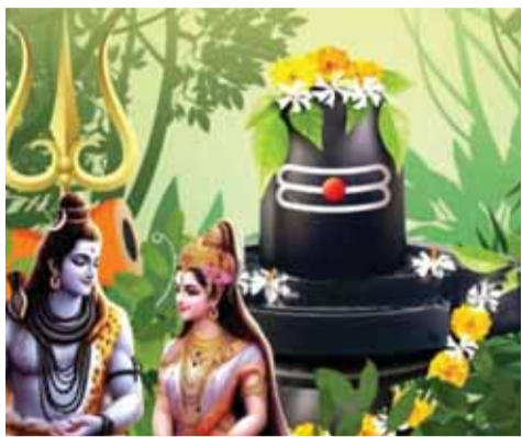
शिवलिंग का पूजन विशेष फलदायी होता है। सुहागिन महिलाएं पूर्व दिशा की ओर मुख कर, अविवाहित कन्याएं

जबलपुर। महिलाओं द्वारा किए जाने वाला हरतालिका तीज का पर्व इस बार मंगलवार, 26 अगस्त को मनाया जाएगा। इस दिन पुराने शहर स्थित सौभाग्येश्वर महादेव मंदिर में बड़ी संख्या में महिलाएं व्रत रखकर भगवान शिव-पार्वती की पूजा-अर्चना करेंगी। मंदिर में पूजन का सिलसिला सोमवार रात 12 बजे से ही शुरू हो जाएगा। पारंपरिक मान्यता के अनुसार विवाहित महिलाएं अखंड सौभाग्य और अविवाहित युवतियां उत्तम वर की कामना से व्रत रखती हैं। इस दौरान महिलाएं कथा सुनेंगी और शिव-पार्वती का विशेष पूजन करेंगी। सौभाग्येश्वर महादेव मंदिर, चौरासी महादेव मंदिरों में से 61वें स्थान पर आता है। यहां हरतालिका तीज पर विशेष पूजन का महत्व माना जाता है।